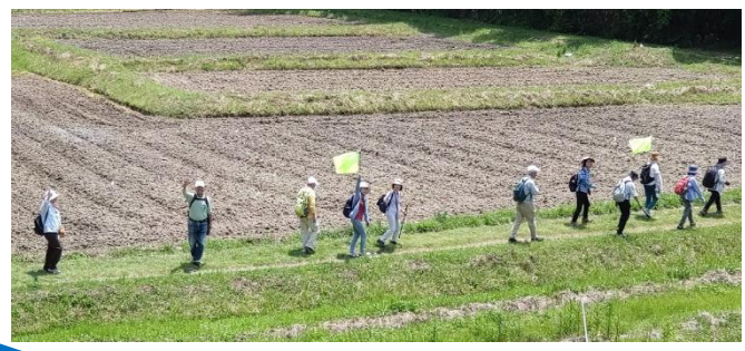
線路が通っていた道→