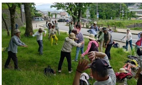
ロートアリーナ近くの公園で体操