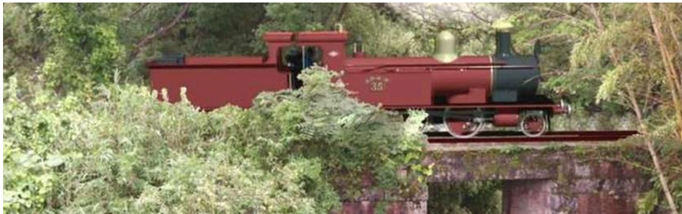
いなずま 大仏鉄道 赤橋上の電光号 開業120周年フェスタから

「大仏鉄道」は、明治時代の鉄道会社『関西鉄道』の加茂と奈良を最短距離で結んだ、約 10 kmの路線の愛称です。明治 31 年に加茂駅から大仏駅の区間が開業。大仏駅は東大寺の大仏詣で多くの人々が利用して、花形路線となった。しかし明治 40 年現在の JR 関西本線が加茂駅から木津駅を経て奈良駅へ至る平坦ルートが開通したため、わずか 9 年で廃線となり『幻の大仏鉄道』と呼ばれている。今回は平成 26 年度、奈良市と木津市が共同で作成した「幻の大仏鉄道 遺構めぐりマップ」に沿って歩きました。