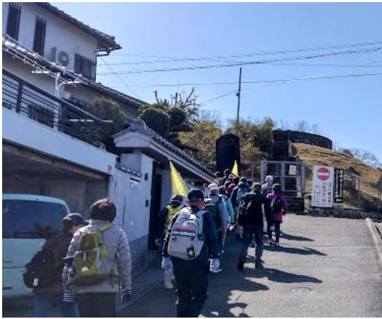
ず〜と住宅内坂道を登って行きました