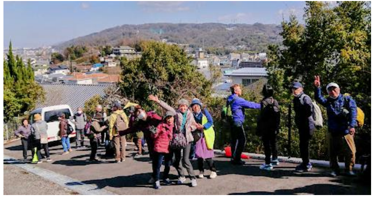
ちょこっと休憩中