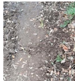
イノシシが掘り起こした道