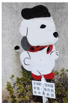
飛出し boy こと雪丸