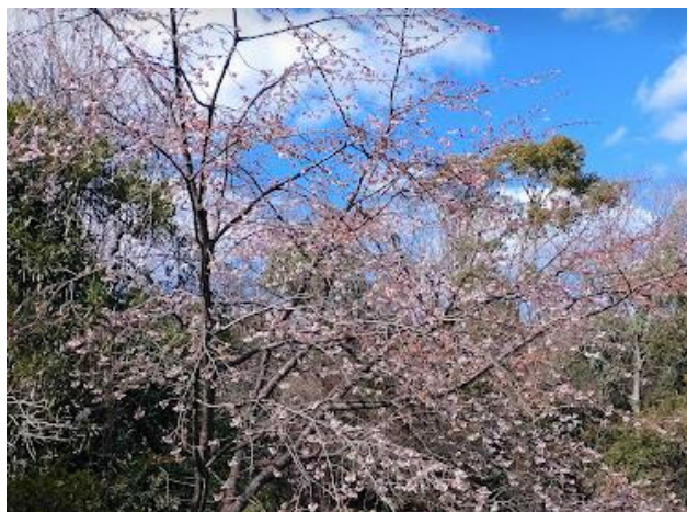
ビックリ! 満開の桜