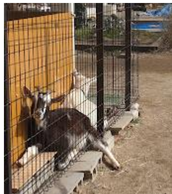
白ヤギさんと黒ヤギさん