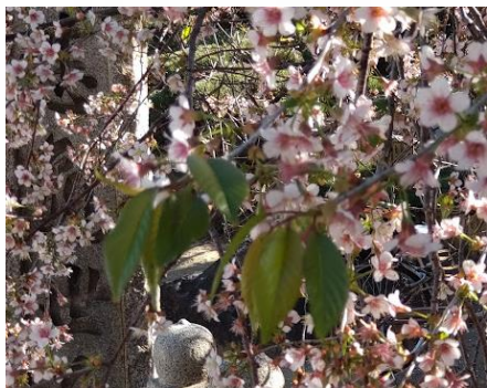
寒桜、綺麗だったね!