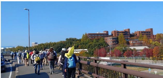
2016年大阪国際大学枚方キャンパス閉鎖