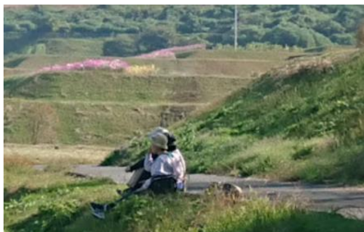
ほのぼの昼食タイム

皆が気になった、土の山は 残土の山なのか、建設汚泥 を固化処理した再生土なの か、高さ60mの山 …… ショック!