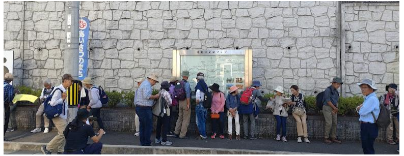
尊延寺公民館前で小休憩