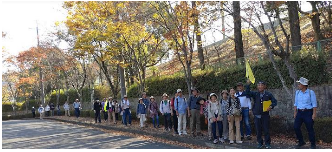
乗馬場の入口紅葉のトンネル