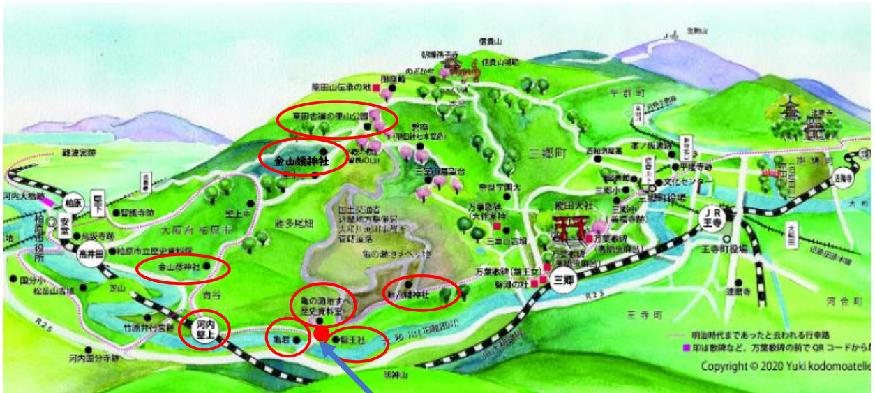
ずいどう 旧大阪鉄道亀瀬隧道（トンネル）

今回の亀の瀬トンネル見学は4月14日、ネットでの予約受付申込からのスタートで、36人の受付に成功しました。天候も心配でしたが、天気にも恵まれ結局、貸切状態で全員見学する事が出来ました。