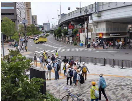
難波 CITY 阪神高速 1 号線側