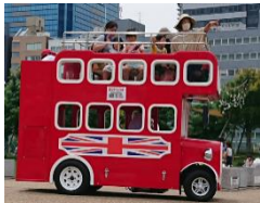
てんしば公園で昼食タイム 子供たちがいっぱいでした。