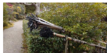
昨年使用された松明