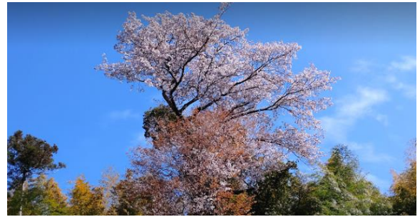
とても大きなヤマサクラ