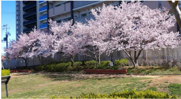
日根野駅をスタートしていきなり見事な桜並木