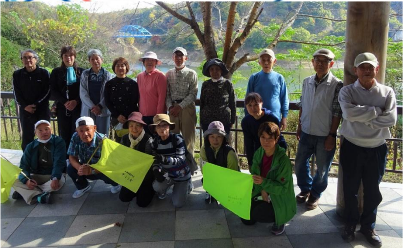
湖畔の駐車場で昼食タイム