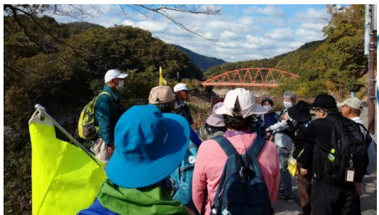
一海さんの一庫ダムの説明