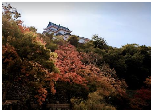
御橋廊下から見た天守閣