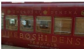
和歌山駅うめぼし電車

天気にも恵まれ、紅葉もきれいに色づき、素晴らしい例会でした。和歌山城は山の上にあ り、いろんな場所から、城を眺めることができるのは、羨ましく思いました。きれいな町並 みで、大きなお寺が多く、昔の城下町を垣間見た。9kmも皆さん余裕でしたね。今回は JR 組と南海組に別れて解散しました。 おまけで、珍しい電車を見ることが出来たので載せました。