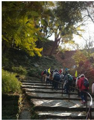
裏坂を一気に登り天守閣へ