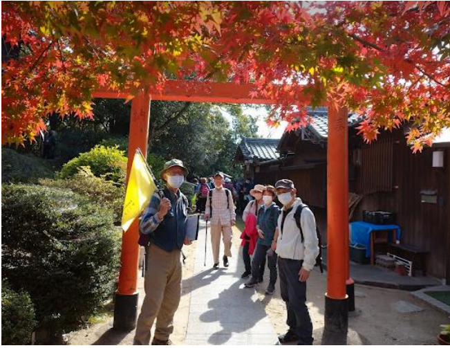
一番きれいな紅葉でした