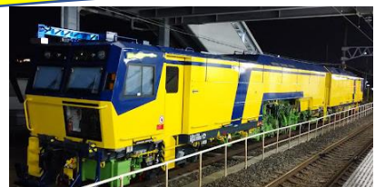
熊取駅ドクターイエロー電車