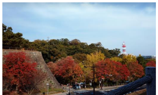
あかずもん 岡山の時鐘堂からの不明門跡