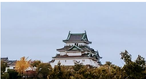
岡公園の岩に登りやっと撮影しました

石質は結晶片岩で「紀州の青石」と呼ばれている。ここで切り出された石材は、天守台や本丸周辺の石垣などに用いられたと考えられる。