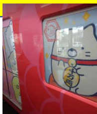
和歌山市駅めでたい電車