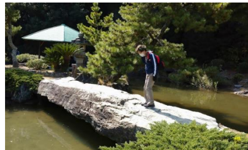
1億円の青岩の一枚岩でできた橋