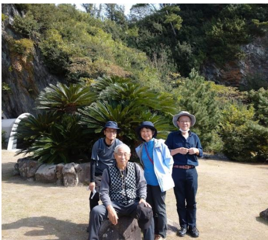
プライベートビーチ